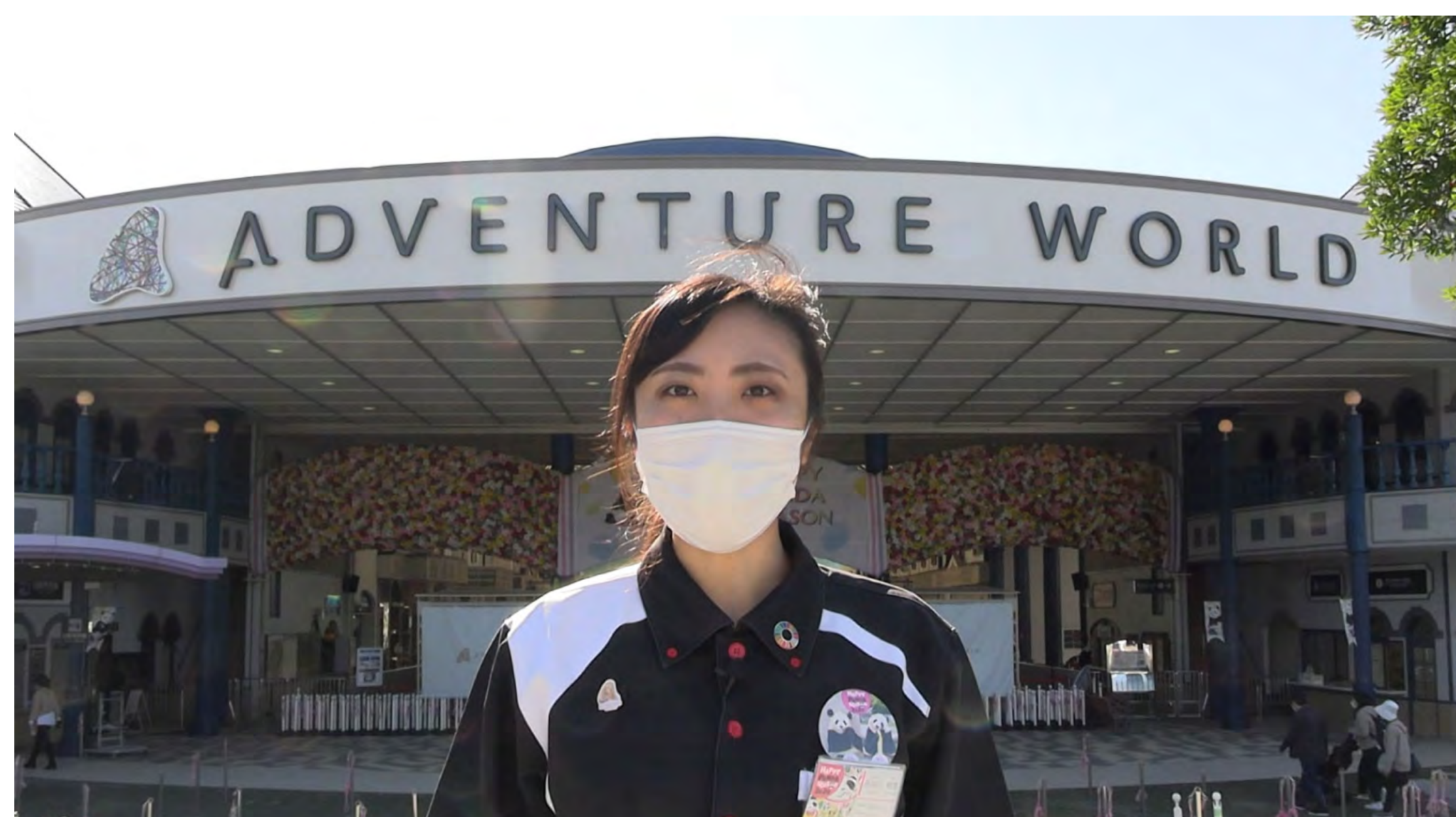
パークの感染症予防対策について