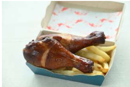
スモークチキンコンボ 1,000円 販売場所：マリンブルー