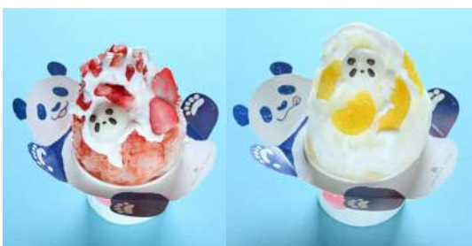
サマーフレッシュフラッパ 2種類：いちご／はっさく 850円 販売場所：パン工房