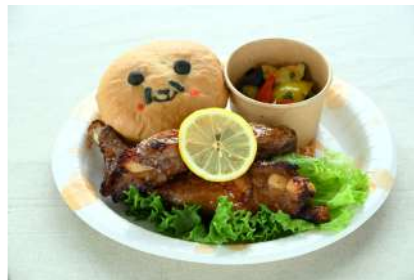
～暑い夏を楽しむ！～ 豪快！スペアリブプレート 1,980円 販売場所：パン工房