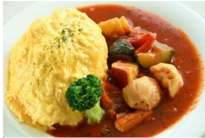
冷製トマトスープオムライス 1,200円 販売場所：キッチン