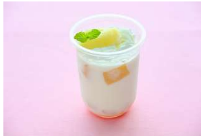
ひんやりあら川のももラッシー 750円 販売場所：SmileKitchen