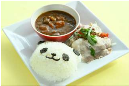
紀州うめぶたの冷しゃぶカレー 1,300円 販売場所：マルシェ