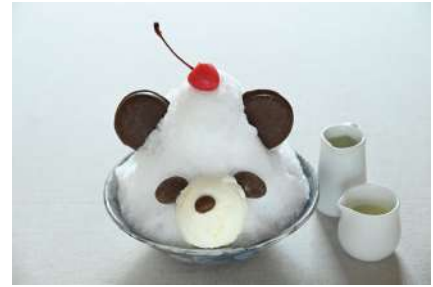
パンダかき氷 1,000円 販売場所：丼亭