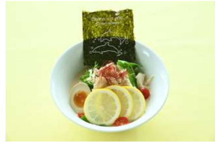
みかん鶏の冷やしラーメン 1,300円 販売場所：マアム