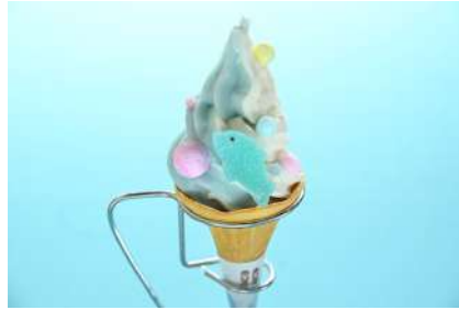
キラキラドルフィンソフト 600円 販売場所：ヒポバーガー