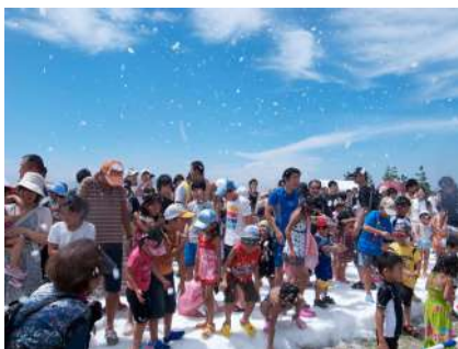
※サマースノーパークのイメージ