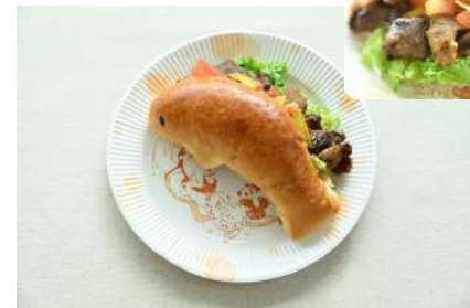
スタミナビーフサンド 1,000円 販売場所：マリンブルーⅡ