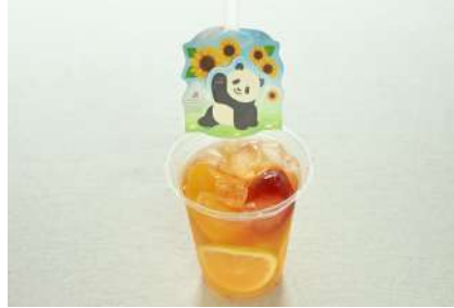
フロズンフルーツティー 500円 販売場所：レインボー