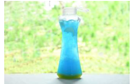
UMI to KIRAKIRA 850円 販売場所：サムズ