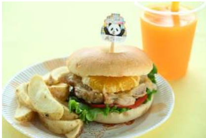
フレッシュなオレンジをトッピング 紀州みかん鶏のフルーツバーガー ・単品 1,200円 ・プレミアムセット（和歌山みかんジュースとポテト）1,860円 販売場所：ヒポバーガー