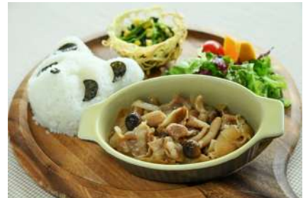
夏のスタミナポークジンジャー 1,650円 販売場所：SmileKitchen