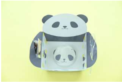
ぷるぷるパンダわらびもち 500円 販売場所：ラシュレ