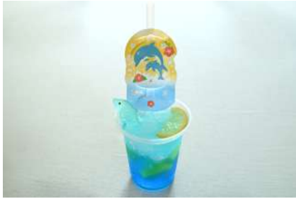
Smilesスカッシュ 600円 販売場所：マリンプルー