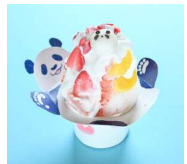
裏メニュー「いちご&はっさく味」