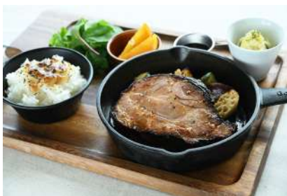
JamboでCAMP飯！ 厚切りローストポークプレート 2,980円 販売場所：Jambo