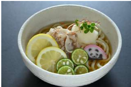
すだちとレモンの冷しゃぶうどん 1,200円 販売場所：丼亭