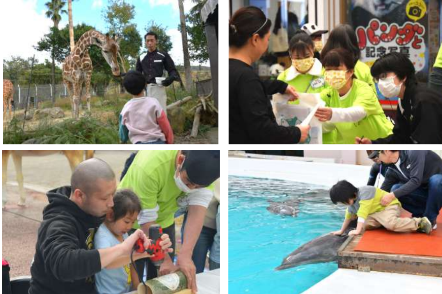
2023年11月23日開催の様子

「ドリムデイ・アット・ザ・ズー（主催：和歌山ドリデイ2024実行委員会）」を2024年11月6日（水）アドベンチャーワールド（和歌山県白浜町）で開催いたします。アドベンチャーワールドで、どのような特性や属性の方も気兼ねなく、自由にお楽しみいただけるときをお過ごしいただきたく、以下の通り開催のご案内を申し上げます。