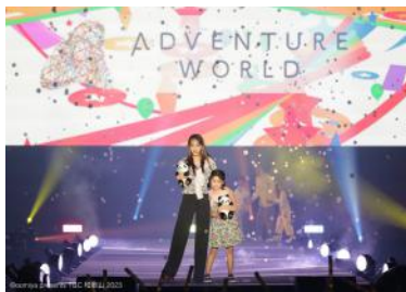
「oomiya presents TGC 和歌山 2023」パートナーステージの様子

ステージ名：「きらぼしキッズコレクション supported by アドベンチャーワールド」（以下：きらぼしキッズコレクション）