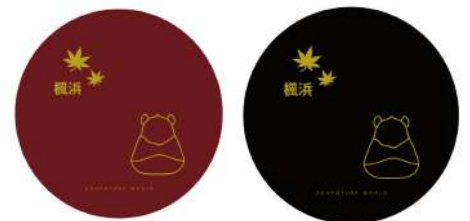
丸盆デザインイメージ

体験内容について詳しくはこちら http://www.chuokai-wakayama.or.jp/sikki-k/02_taiken.html