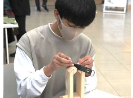
昨年のイベントの様子