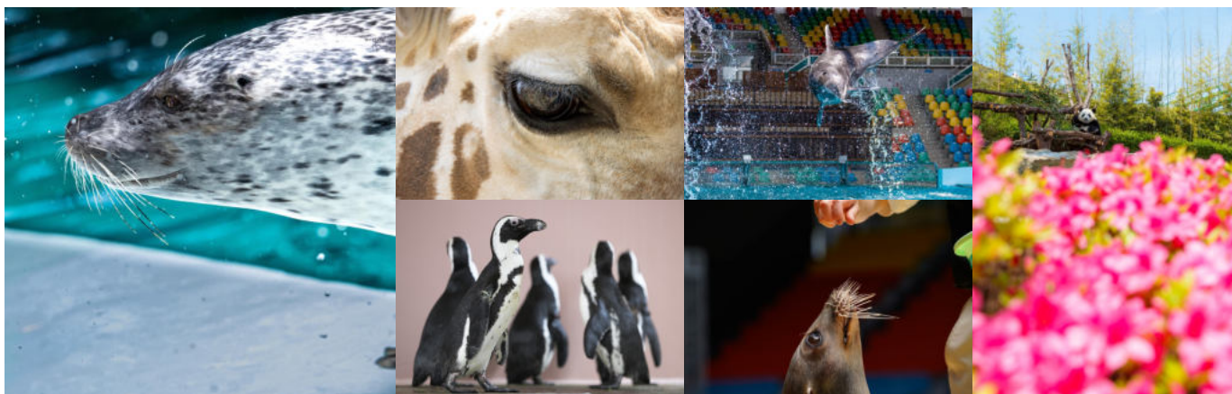
前回イベント参加者の撮影写真