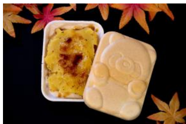
「パンダ蜜芋もなか」 500円 販売店舗：ラシュレ