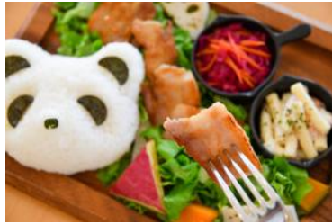
「パンダと秋のポークジンジャープレート」 1,480円 販売店舗：Smile Kitchen