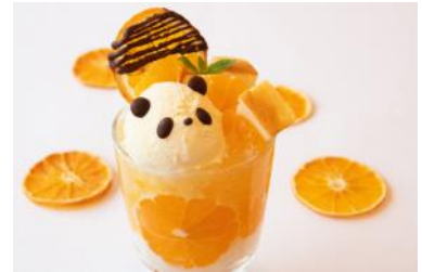
「味わう秋のみかんパフェ」 780円 販売店舗：Smile Kitchen