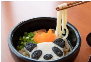
「パンダうどん」 1,000円 販売店舗：サムズ