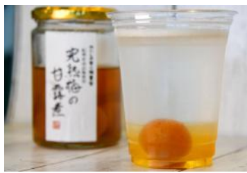
「プラムスカッシュ」