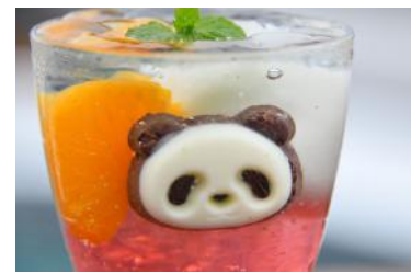
「アクアリウムパンダ」