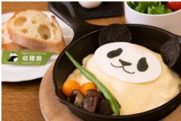
「クリーミーホワイトソースのパンダハンバーグ」 2,790円 販売店舗：Jambo