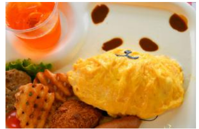
「パンダプレート」 1,200円 販売店舗：キッチン