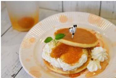
「パンダの梅ジャムパンケーキ」