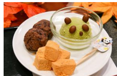
「パンダ和スイーツ」 800円 販売店舗：井亭