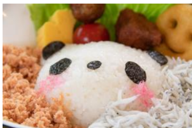
「パンダランチ」 1,000円 販売店舗：マアム