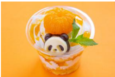
「丸ごとみかんパンダ」 650円 販売店舗：マルシェ