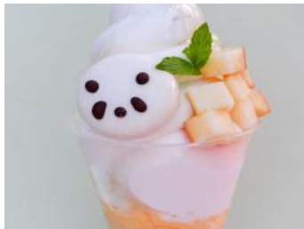
「パンダとハマル秋パフェ」 700円 販売店舗：パン工房