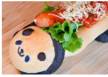
「うめぶたソーセージのパンダホットドッグ」