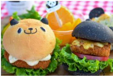
「わかやま食べ比べ！パンダミニバーガープレート」 1,680円 販売店舗：パン工房