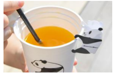
「和歌山みかんジンジャーエール」 450円 販売店舗：パン工房