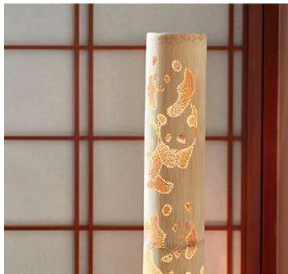
間接照明「竹あかり」