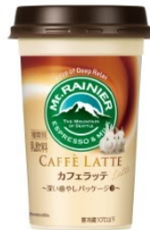
伊豆アニマルキングダム ウサギ