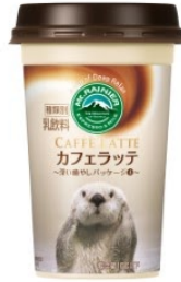
鳥羽水族館 ラッコ(メイ)