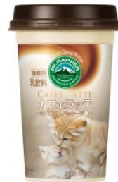
神戸どうぶつ王国 スナネコ(マフ)