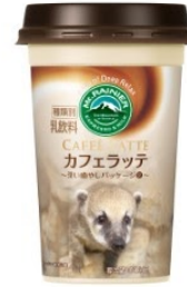
伊豆シャボテン動物公園 アカハナグマ