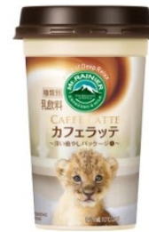
アフリカンサファリ ライオン(こらめ)