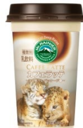
アフリカンサファリ トラ(パール)ライオン(ふさころう)