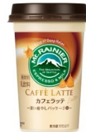
おたる水族館 フウセンウオ