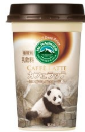
アドベンチャーワールド パンダ(楓浜)