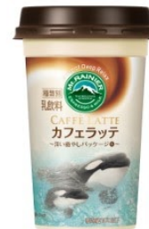
鴨川シーワールド シャチ