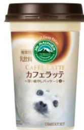
おたる水族館 ゴマフザラシ(モモたろう)