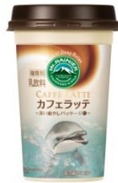
横浜・八景島シーパラダイス カマイルカ(ハル)