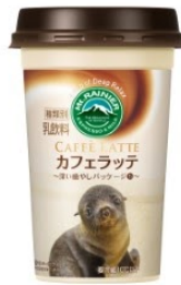
登別マリンパークニクス ミニアメリカオットセイ(チー)