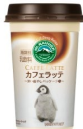
アドベンチャーワールド エンペラーペンギン