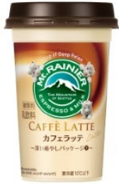
伊豆アニマルキングダム ホワイトタイガー(バニラ/メレンゲ/ホイップ)