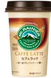
登別マリンパークニクス カクレクマノミ