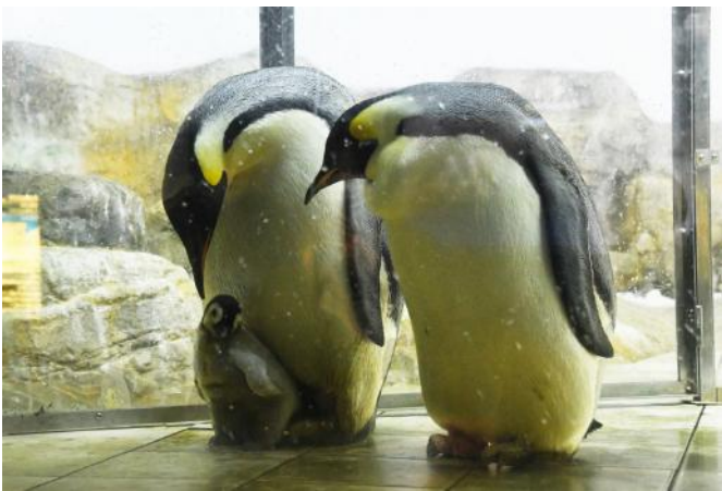
10月2日生まれの赤ちゃんとお親鳥 11月13日撮影