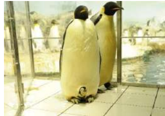
2013年誕生の赤ちゃん