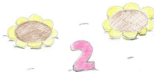
プレゼントイメージ