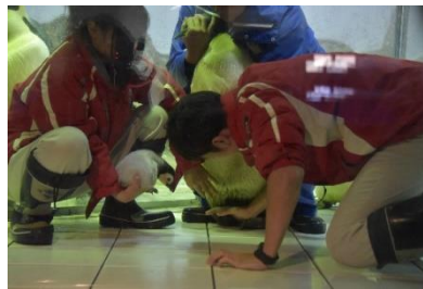
②生後約3週間で親鳥のもとへ返す