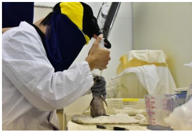
①スタッフが親鳥に扮して給餌する (体重が約500gになるまで)