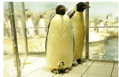
③生後約1か月（2013年に誕生した赤ちゃん）