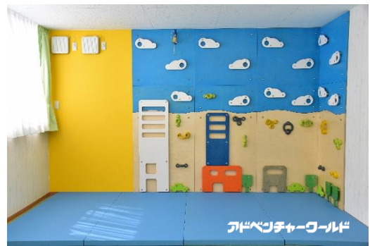
クライミングウォール