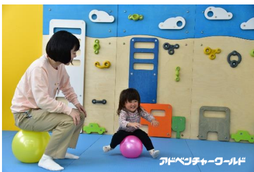
保育風景イメージ