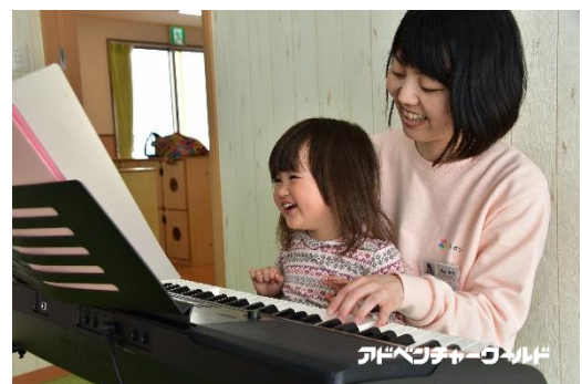
保育風景イメージ