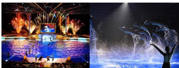
〈ナイトマリンライブ「LOVES」〉

当社では、今後もホンモノの笑顔あふれる豊かな社会の実現にむけて、企業理念「こころでときを創る Smile カンパニー」のもと、お客様、パートナーである動物、社会の Smile の創造を目指し、より一層の付加価値向上に努め成長してまいります。