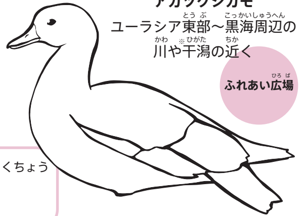
アカツクシガモ ユーラシア東部～黒海周辺の 川や干潟の近く