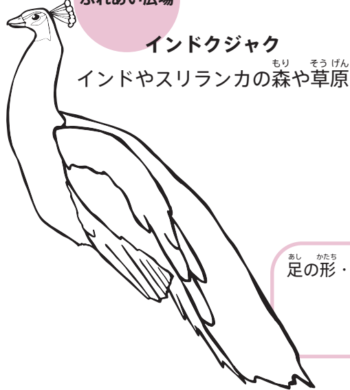
インドクジャク インドやスリランカの森や草原