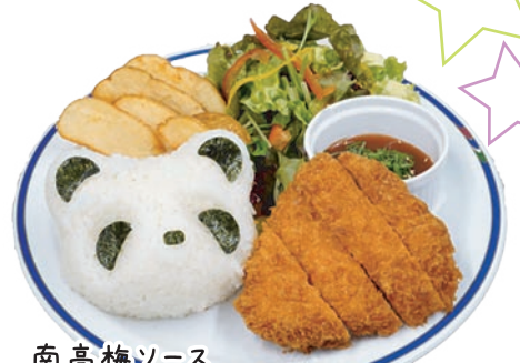
南高梅ソース チキンカツ 🍗🍷🌾🍷🍷 ¥1,400 和歌山県の紀州南高梅使用