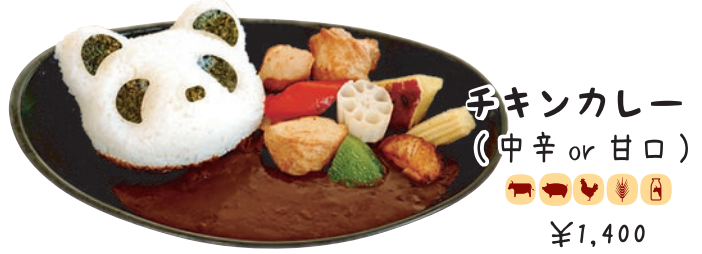
チキンカレー (中辛 or 甘口) 🍗🍷🍗🍷🌾🍷🍷 ¥1,400 和歌山県の紀の国みかんどり使用