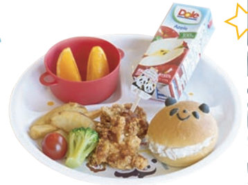
キッズサンド(ツナ) 🍗🍷🍗🍷🌾🍷🍷 ¥1,100