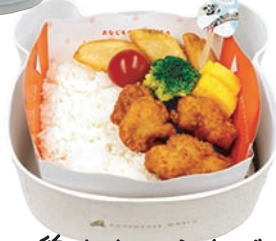
鶏ももからあげ 🍗🍷🍗🍷🌾🍷🍷 ¥1,400