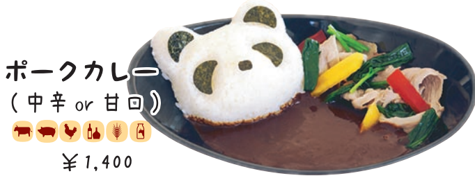
ポークカレー (中辛 or 甘口) 🍗🍷🍗🍷🌾🍷🍷 ¥1,400 和歌山県の熊野ポーク使用