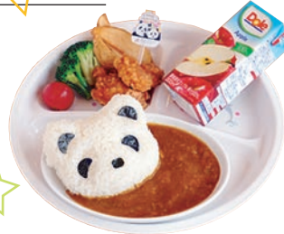
キッズカレー(甘口) 🍗🍷🍗🍷🌾🍷🍷 ¥1,100