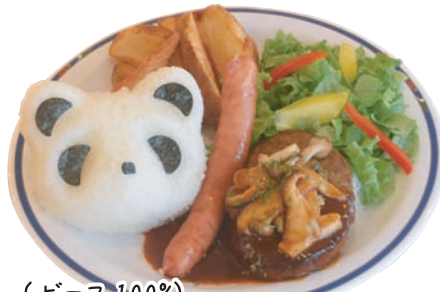
(ビーフ100%) きのこデミハンバーグ 🍗🍷🌾🍷🍷 ¥1,650 和歌山県龍神村のしいたけ使用