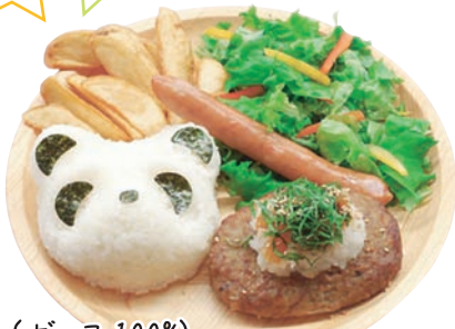
(ビーフ100%) おろしハンバーグ 🍗🍷🌾🍷🍷 ¥1,650 和歌山県湯浅町の湯浅醤油使用