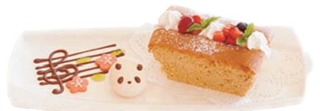
パンダシフォン 🍷🍷🍷 (ベリーと紅茶のシフォンケーキ) ドリンクセット ¥1,030 単品 ¥750